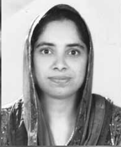
ഡോ. ലീനാ നൗഷാദ്